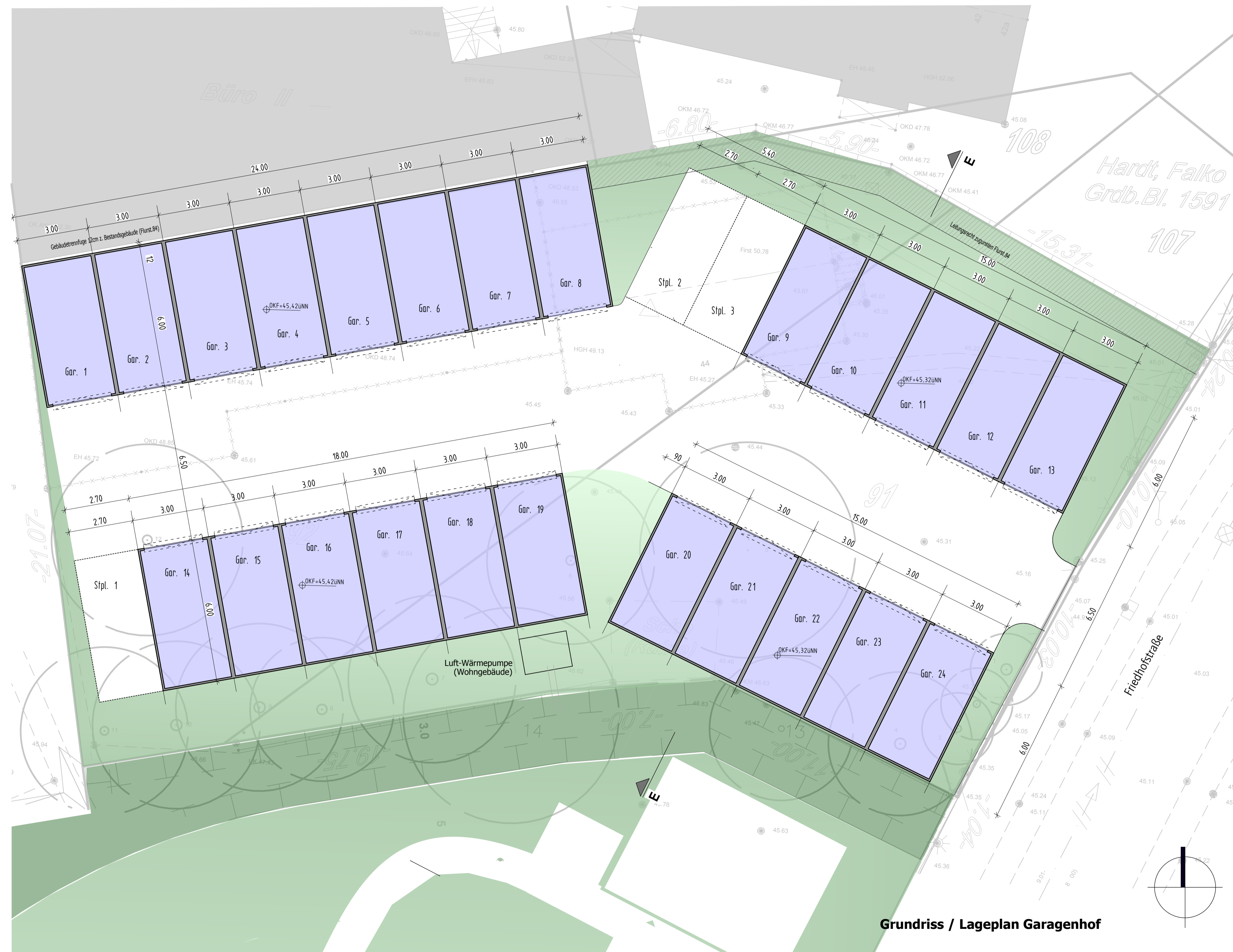
Grundriss / Lageplan Garagenhof