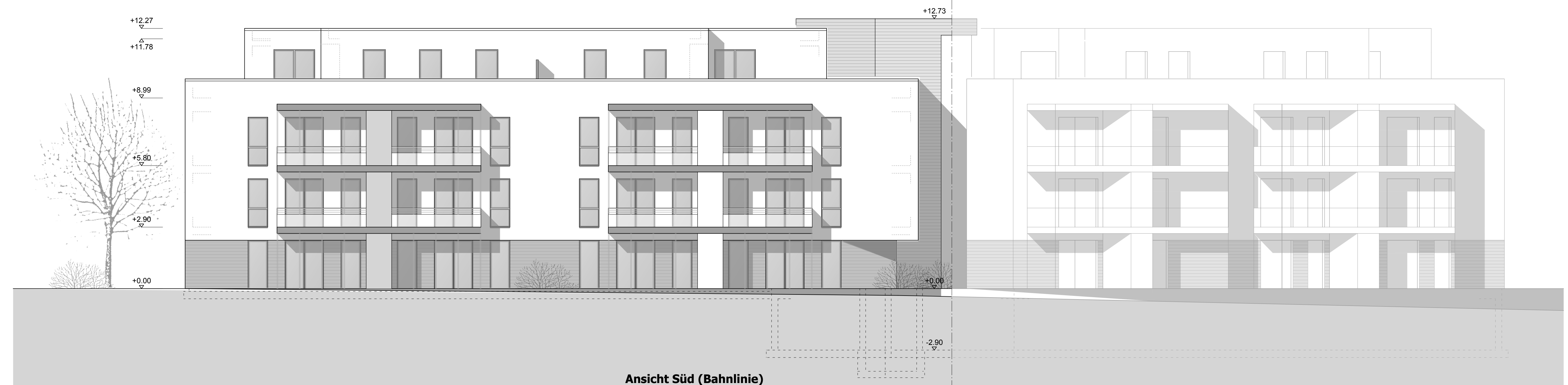
Ansicht Süd (Bahnlinie)